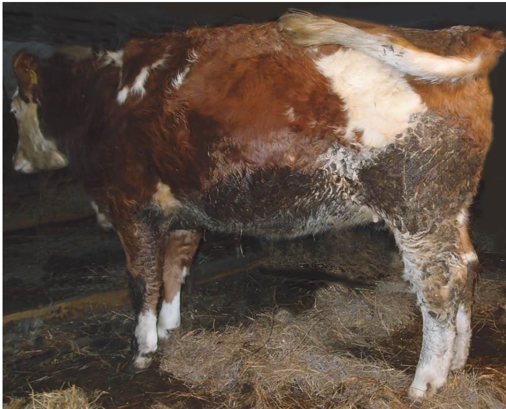
Kuva 3 Likainen