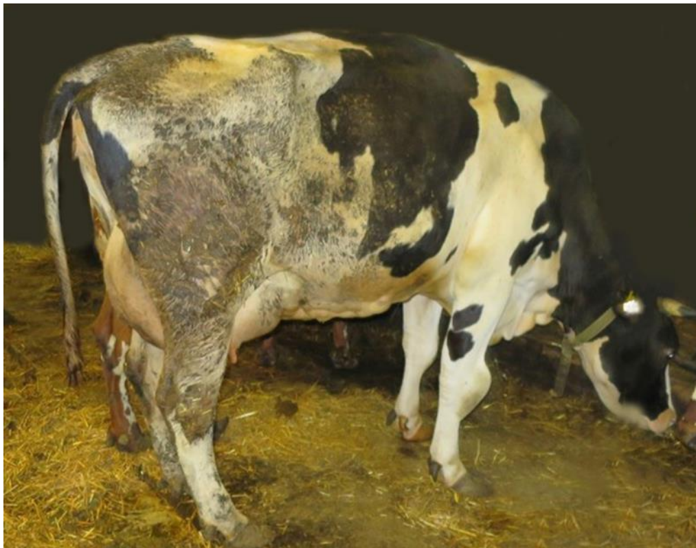
Kuva 4 Likainen