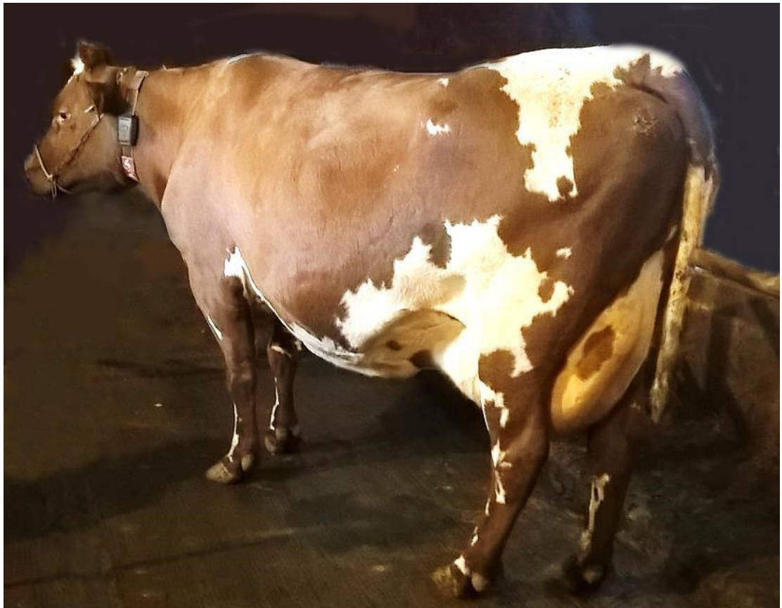
Kuva 1: Puhdas

Valokuvia voi soveltuvin osin hyödyntää myös muiden eläinten likaisuuden arvioinnissa.