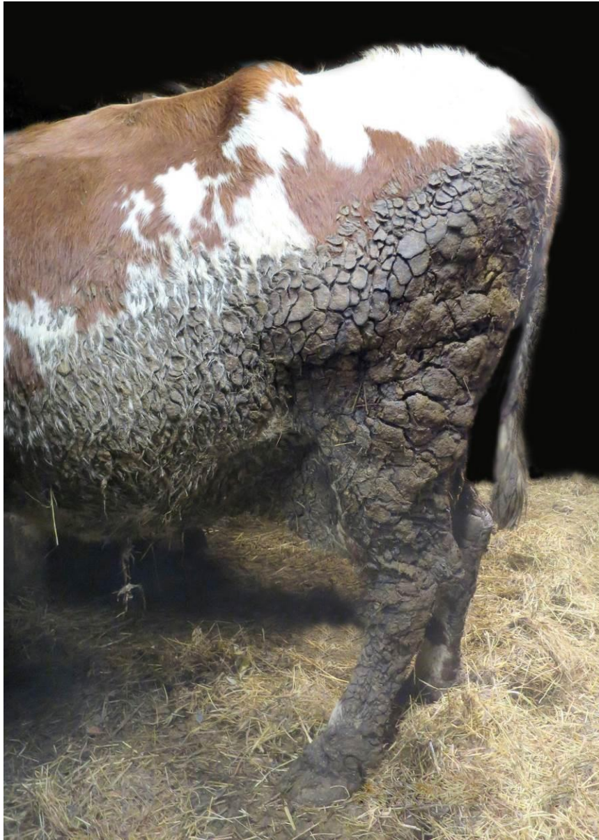
Kuva 6 Erittäin likainen