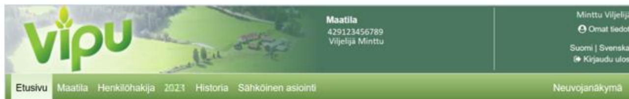
Kuva 1. Valitse sähköinen asiointi.